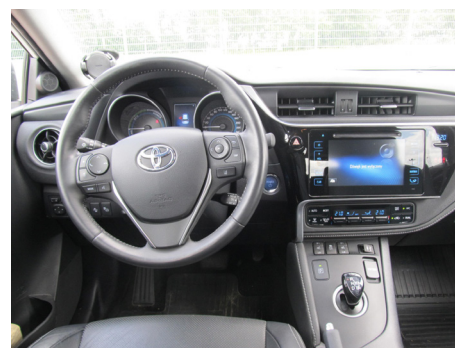
Fot. Wnętrze pojazdu