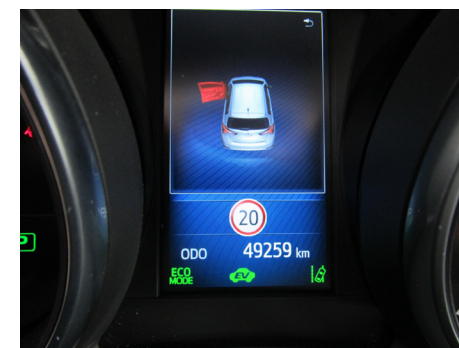
Fot. Stan licznika