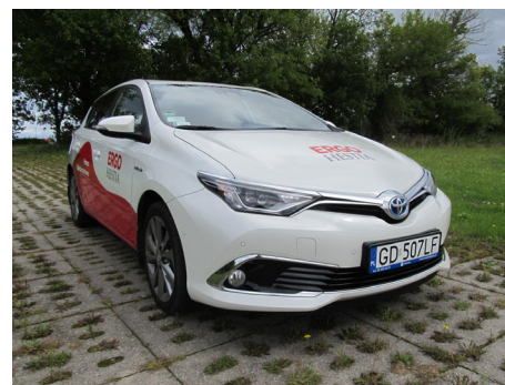
Fot. Widoczny przód, numer rejestracyjny i prawy bok