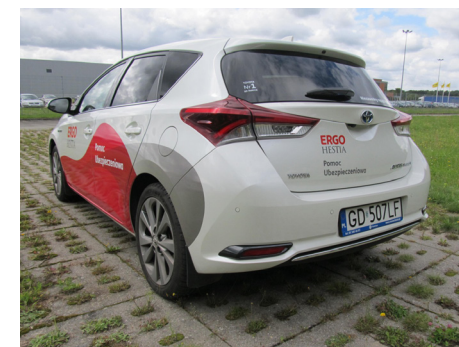
Fot. Widoczny tył, numer rejestracyjny i lewy bok